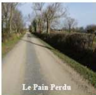
Le Pain Perdu